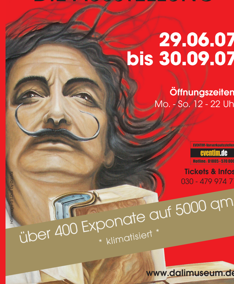
Hörmagel & S. Dalí by Dalí

über 400 Exponate auf 5000 qm * klimatisiert *