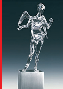
Kubistischer Engel, Auflage 950, Kristall, 55 cm hoch

Gewinnen Sie diese notariell zertifizierte Kristallskulptur von Salvador Dalí (siehe Abb.)