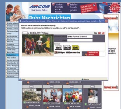
Bestellauswahl: Format, Preis