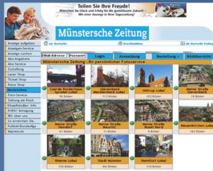
Ankündigungen Foto-Service: Münsterische Zeitung