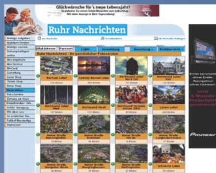
Übersicht Fotoalben – Lokalausgabe